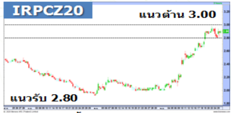
(กราฟทั้งหมดอ้างอิงจากหุ้นสามัญ)