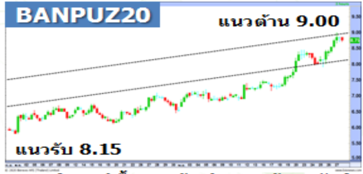
(กราฟทั้งหมดอ้างอิงจากหุ้นสามัญ)