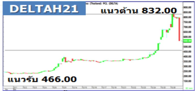
(กราฟทั้งหมดอ้างอิงจากหุ้นสามัญ)