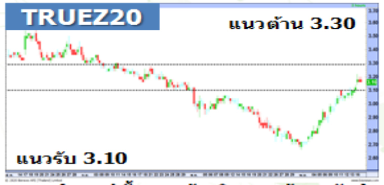
(กราฟทั้งหมดอ้างอิงจากหุ้นสามัญ)