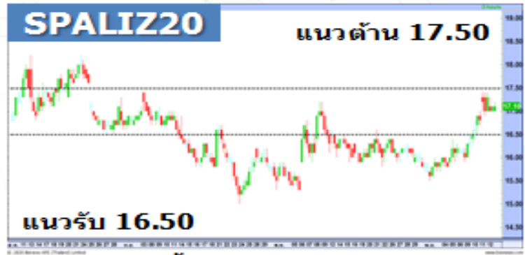
(กราฟทั้งหมดอ้างอิงจากหุ้นสามัญ)